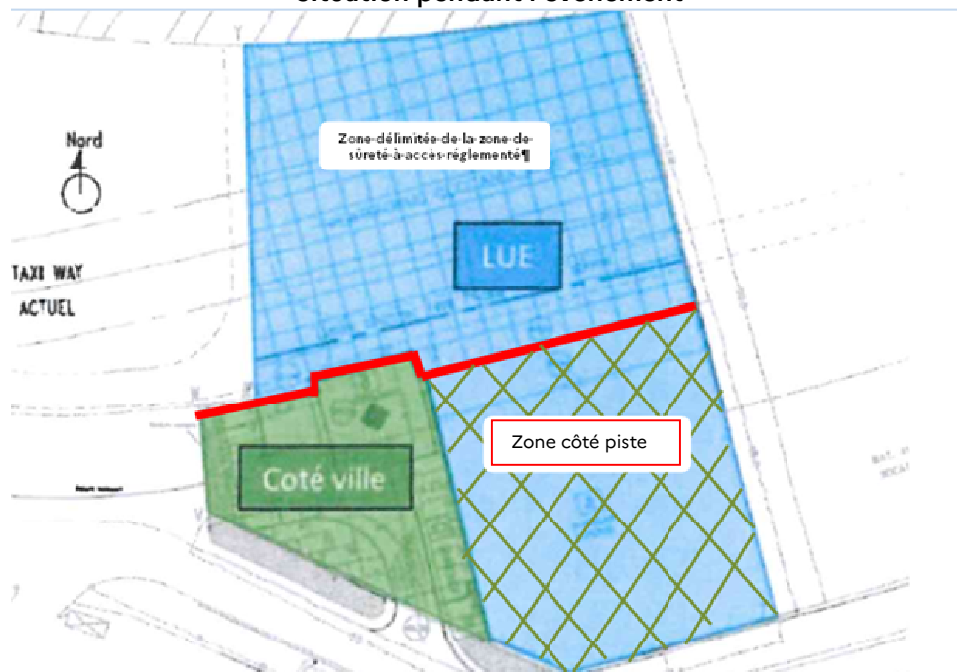
Situation pendant l'évènement